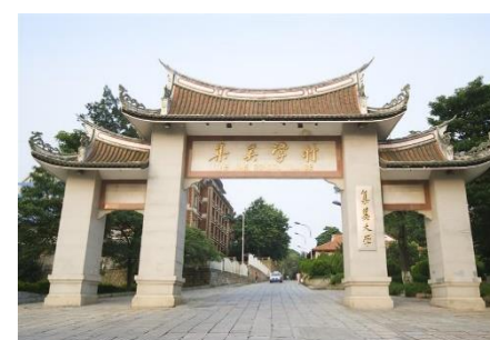
閩南僑鄉風格【集美學村】