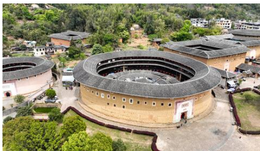
世界文化遺產【高北土樓群】