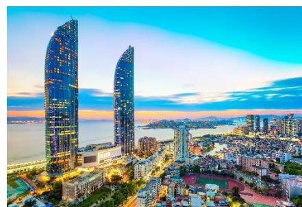
外觀廈門標誌性建築【雙子星塔】

『廈門八市』：八市全名為廈門第八市場，是一個菜市場，一個有著穿越時空般悠久歷史的菜市場，被認為是廈門僅有的留存有閩南古早風格的地方，是廈門最古老的片區之一，最本土的座標。