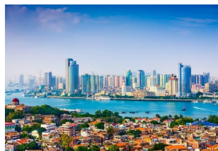
世界文化遺產【鼓浪嶼】