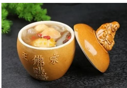
福建十大名菜之首【佛跳牆風味】